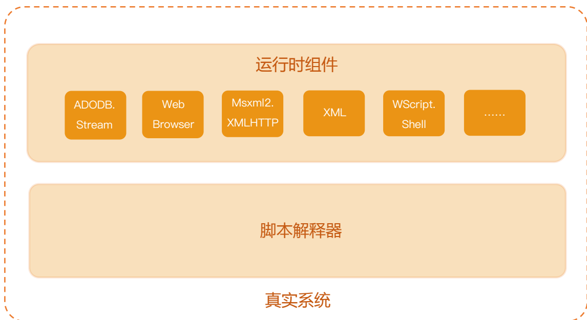
图 2-3、主流脚本虚拟沙盒

同 PE 混淆类病毒一样，通过动态虚拟执行还原被混淆代码的原始数据和行为，才是解决问题之道。基于这样的思路，主流安全厂商都试图通过动态“执行”的方式来解决脚本混淆问题。其中主流的思路是在反病毒引擎中嵌入脚本解释器来分析并执行脚本代码，进而通过对脚本执行时需要的运行时组件进行有限的模拟来分析脚本的运行时行为。其架构大致如下图所示：