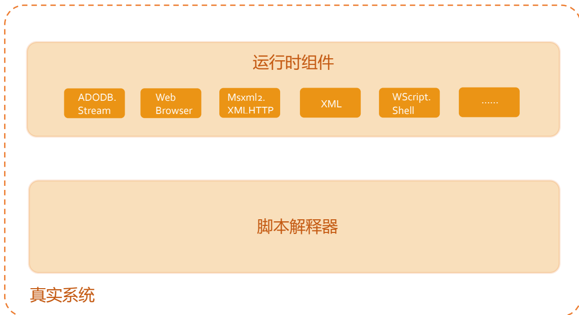
图 2-3、主流脚本虚拟沙盒

同 PE 混淆类病毒一样，通过动态虚拟执行还原被混淆代码的原始数据和行为，才是解决问题之道。基于这样的思路，主流安全厂商都试图通过动态“执行”的方式来解决脚本混淆问题。其中主流的思路是在反病毒引擎中嵌入脚本解释器来分析并执行脚本代码，进而通过对脚本执行时需要的运行时组件进行有限的模拟来分析脚本的运行时行为。其架构大致如下图所示：